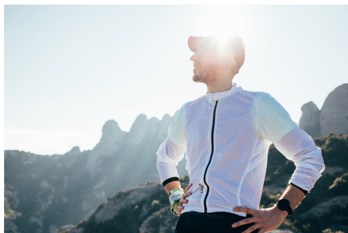
Badania w obszarze sportów wytrzymałościowych potwierdzają 11-procentowy wzrost wydajności po zażyciu Vita Pure.

Podobnie jak prawidłowo funkcjonujący staw, człowiek również potrzebuje zrównoważonego dopływu zaopatrzenia i oczyszczającego odpływu, aby osiągnąć stan równowagi organizmu.