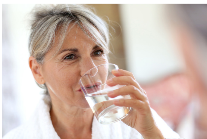
Krzem w Vita Pure wzmacnia tkankę łączną i pomaga organizmowi zachować młodość.

Skąła wulkaniczna wchodząca w skład Vita Pure to glinokrzemian zawierający krzem. Minerale ten ma szczególne znaczenie w regeneracji tkanki łącznej. Jest przyjmowany przez organizm w formie dwutlenku krzemu i spowalnia procesy starzenia oraz powstawanie zmarszczek. Wzmacnia paznokcie i włosy oraz sprawia, że tkanki są bardziej napięte. Po osiągnięciu wieku dorosłego zawartość krzemu we krwi stopniowo maleje i powinien on być suplementowany przez całe życie, w szczególności przez pokolenie 50+.